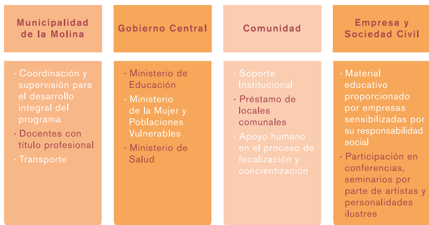
Gráfico N.º 3