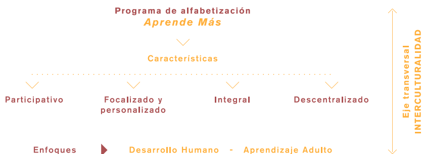
Gráfico N.º 2